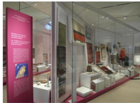
皇家安大略博物館與其展廳中展出的馬偕臺灣文物