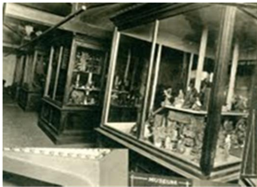
1915年之前Knox College Museum展出的馬偕藏品

1905 年「諾克斯學院」(Knox College) 因為與多倫多大學整併而遷移，這一批珍貴的馬偕藏品當時輾轉移交給現今位於多倫多市的皇家安大略博物館 (Royal Ontario Museum, ROM) 保存。現今 310 多組/件馬偕 130 年前採集的臺灣文物仍保存在加拿大多倫多皇家安大略博物館 (ROM)。